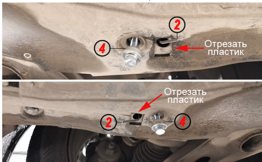
Рис. 1, 2

Honda ZR-V (рынок Японии, правый руль) Honda Civic XI (рынок Китая) Honda HR-V (RZ) (рынок США и Канады) Honda Integra (рынок Китая)